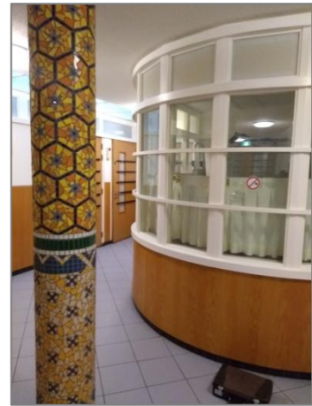
Versleten meubilair is vervangen, het klassieke meubilair is gebleven, er hangen nieuwe energiezuinige lampen, en het houtwerk, de muren en de plafonds zijn geschilderd.