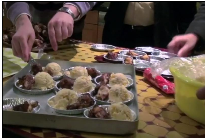
Bij feestelijke activiteiten worden hapjes en drankjes geserveerd uit diverse culturen

Een paar jaar geleden is een activiteit gestart voor oudere Turkse vrouwen die bijna geen Nederlands spreken. Het eerste jaar hebben ze samen de Koran gelezen, gepraat en koffie gedronken. Voor hen hielp dat tegen eenzaamheid. Later vroegen ze om een cursus. Met PuntjeP (van de GGD) is geregeld dat ze meerdere cursussen hebben gehad. In 2016 zijn Nederlandse taallessen voor de 1 e generatie Turkse vrouwen georganiseerd en wordt Bewegen op muziek een keer per week voor deze doelgroep georganiseerd. In 2016 is voor de Marokkaanse vrouwen eenzelfde traject gestart.