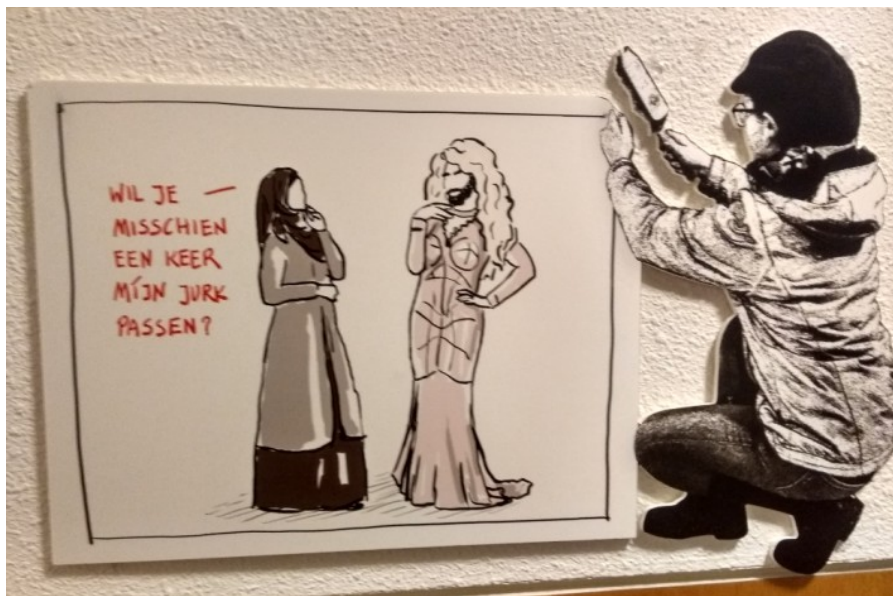
Een van de cartoons van de activiteit en tentoonstelling “Stig maar niet” waar bezoekers van De Hudsonhof in 2019 aan hebben meegedaan

Om een goed beeld te krijgen van de spreiding over de verschillende doelen, zijn alle activiteiten in het samenvattende overzicht ingedeeld bij een van de hoofdoelen. Dat geeft echter een vertekend beeld. Voorlichting kan ook gezondheid tot doel hebben, bewegen kan ook bijdragen aan gezondheid en activeren. Dit hebben we nevendoelen genoemd. Deze zijn ook opgenomen in de samenvattende tabel. Uit de tabel blijkt dat de activiteiten redelijk zijn gespreid. Gezondheid en bewegen springt er uit. Deels om dat er rond gezondheid veel voorlichtingen zijn georganiseerd, deels omdat Surizumba ook digitaal is doorgegaan. Rond samenredzaamheid en het samenbrengen zijn in 2020 veel minder activiteiten georganiseerd. Dat komt omdat de activiteiten vooral waren gericht op de vaste bezoekers die een steuntje in de rug nodig hebben. De sociale ontmoetingen die horen bij samenbrengen hadden niet de prioriteit, op een moment dat de gemeente Amsterdam oproept om “de sociale contacten drastisch te beperken”.