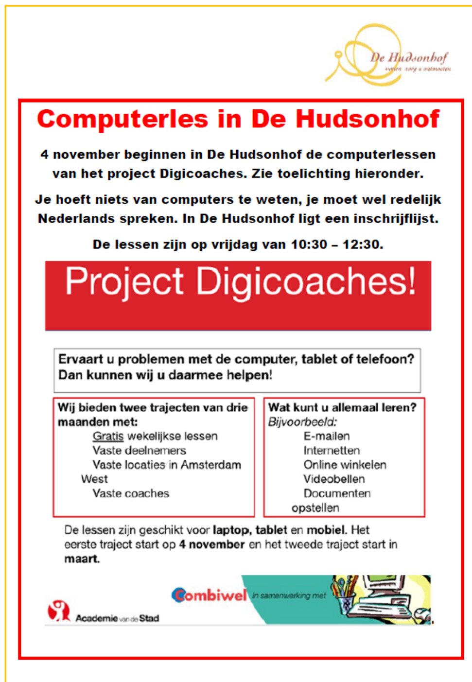
Poster voor het werven van deelnemers voor het project digicoaches

Eind 2022 zijn er ook weer computerlessen geweest van het project Digicoaches van Academie van de Stad. Dat is een project voor mensen met een migrantenachtergrond en voor ouderen, dus precies de bezoekers van De Hudsonhof. Een team stagiairs van verschillende studierichtingen helpt mensen om hun digitale vaardigheden te verbeteren. Bijvoorbeeld het installeren van apps, het omgaan met e-mailprogramma's en alles ertussen. Er was veel belangstelling voor en de deelnemers waren enthousiast.