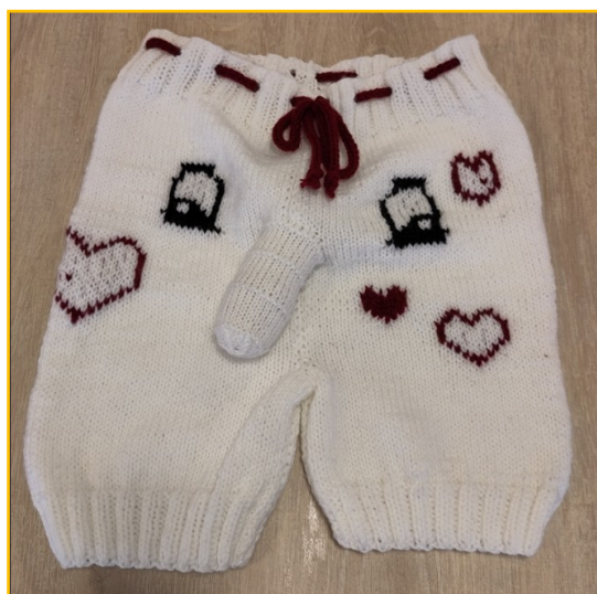
Humor uit de handwerkclub

Een dame uit de handwerkclub: het is gewoon gezellig om elkaar hier te ontmoeten en de gastvrouwen zorgen altijd heel goed voor ons. En ik kom hier ook altijd naar Chi Kung. Het is goed dat er dat ook is.