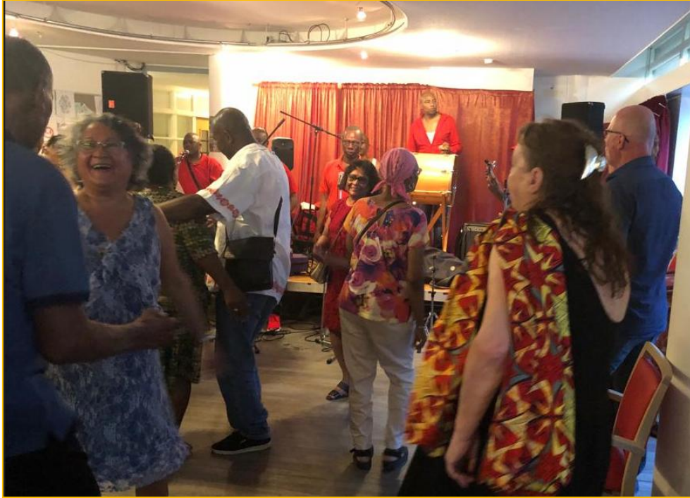
Dansen op muziek van de Surinaamse band