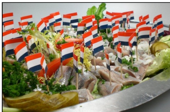
Bij het jubileumfeest zijn zelfgemaakte Marokkaanse, Surinaamse, Irakese, Bosnische en Turkse hapjes gepresenteerd, en Hollandse haring en kaasblokjes.