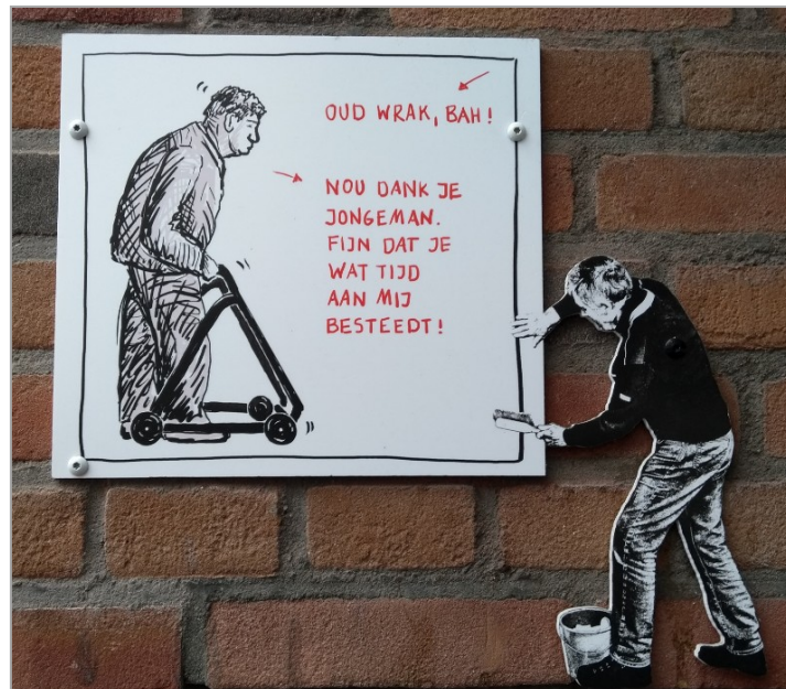
Een van de cartoons van de activiteit en tentoonstelling "Stig maar niet" waar bezoekers van De Hudsonhof aan hebben meegedaan. Deze cartoon hangt buiten aan de gevel.

Stichting Vrienden van De Hudsonhof is een samenvoeging van het voormalige partnerbeeraad en Stichting Vrienden van De Hudsonhof. Het doel van deze Stichting is het beheer van het concept Hudsonhof en werven van fondsen om De Hudsonhof in stand te houden. Een ander doel van de stichting is fondsenwerving voor onderhoud en vervanging van inventaris.