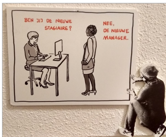
Een van de cartoons van de activiteit en tentoonstelling "Stig maar niet" waar bezoekers van De Hudsonhof aan hebben meegedaan

Tijdens de open inloop is er in ruimte 1 ook een internetcafé, waarbij bezoekers hulp kunnen krijgen met het gebruik van een computer. Dat is een laagdrempelige manier om dit te leren. In de aantallen bezoekers in de samenvatting, zijn de bezoekers van de open inloop en deelnemers aan het internetcafé niet meegeteld.